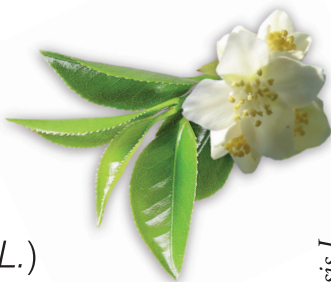
Camellia sinensis L.

el concentrado de PIMIENTO ( Capsicum annuum L. ) estimula el gasto energético e impide la acumulación de grasa en el organismo.